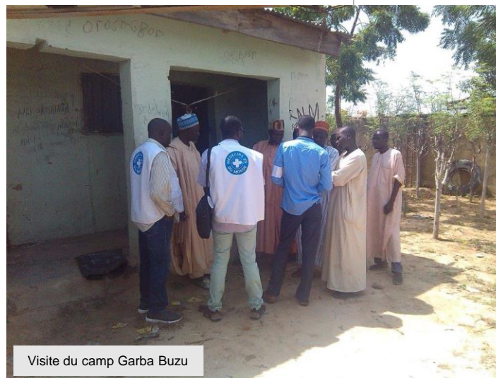
Visite du camp Garba Buzu