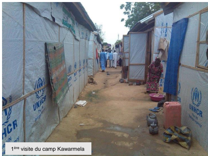
1 ère visite du camp Kawarmela