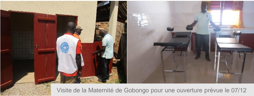
Visite de la Maternité de Gobongo pour une ouverture prévue le 07/12

Enfin, MdM a développé un volet de prise en charge holistique des VLG.