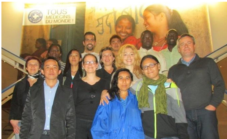
Les stagiaires ayant participé à la formation de formateurs en avril dernier.

Et c'est reparti ! La première session de formation de formateurs organisée en partenariat avec Bioforce s'est déroulée du 11 au 18 avril dernier.